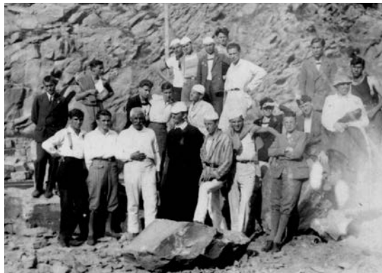
A DÉDPAPA DIÁKOKKAL A BÁNYÁBAN