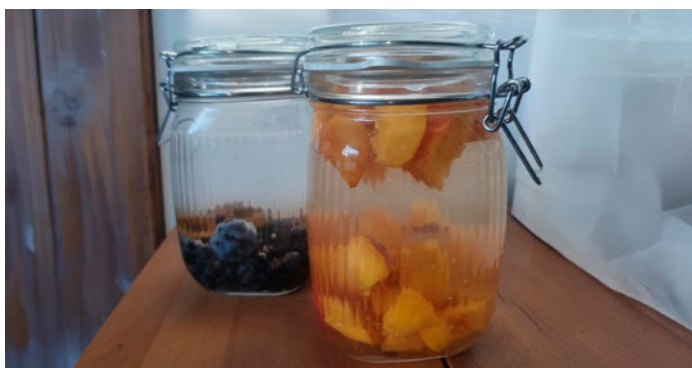
↓ a bőség hónapja