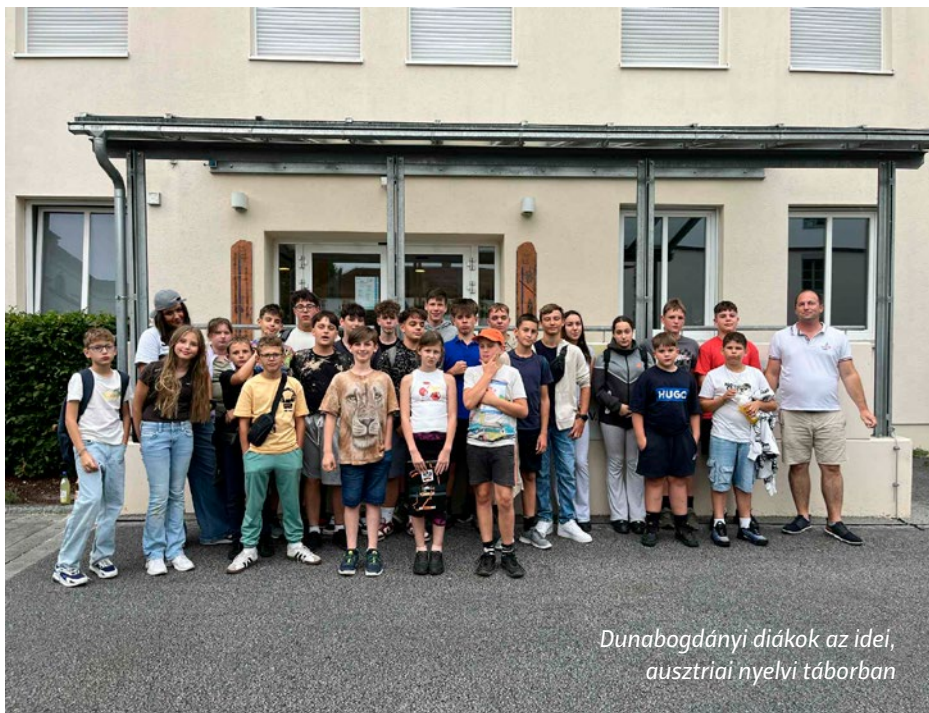
Dunabogdányi diákok az idei, ausztriai nyelvi táborban

Mi a helyzet a középfokú oktatásban? A szakképző iskolákban, a szakköznevelőkben és a gimnáziumokban az angol nyelv után a második leggyakrabban választott nyelv, a német. Érdekeség, hogy a 2024/2025. tanévben 202 ezer diák tanult angolul, 118 ezer diák pedig németül. Az általános iskoláknál tapasztalt 5:1 arány 2:1 alá módosul a gimnáziumokat tekintve, de a másik két iskolatípusnál is szűkebb az olló. Az előző tanévet 715.000 általános iskolás diák kezdte meg, 6,5% (46.094 fő) német nemzetiségi intézményben. 5 Ez azt jelenti,