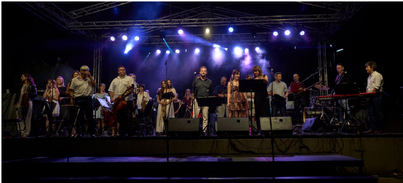
↓ Az Oblivion vonósnégyes koncertje