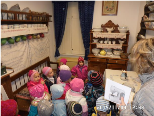
„Gondolkodj egészségesen, nap”