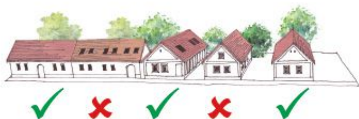
6. ábra 39. oldal

Utólagos tetőtér beépítés esetén minden esetben felmerül az igény tetőablak beépítésére. A hagyományos településközpontban általános szabály, hogy ilyen esetben tetősík ablakot kell alkalmazni. Tetőfelépítmény csak különösen indokolt esetben alkalmazható, melynek pontos kialakítását főépítész konzultáción lehet egyeztetni. A tetősík ablakok utcára néző tetőfelületen nem lehetnek. Hagyományos épület utólagos tetőtér beépítésénél az ormfalon új ablaknyílást nem lehet nyitni.