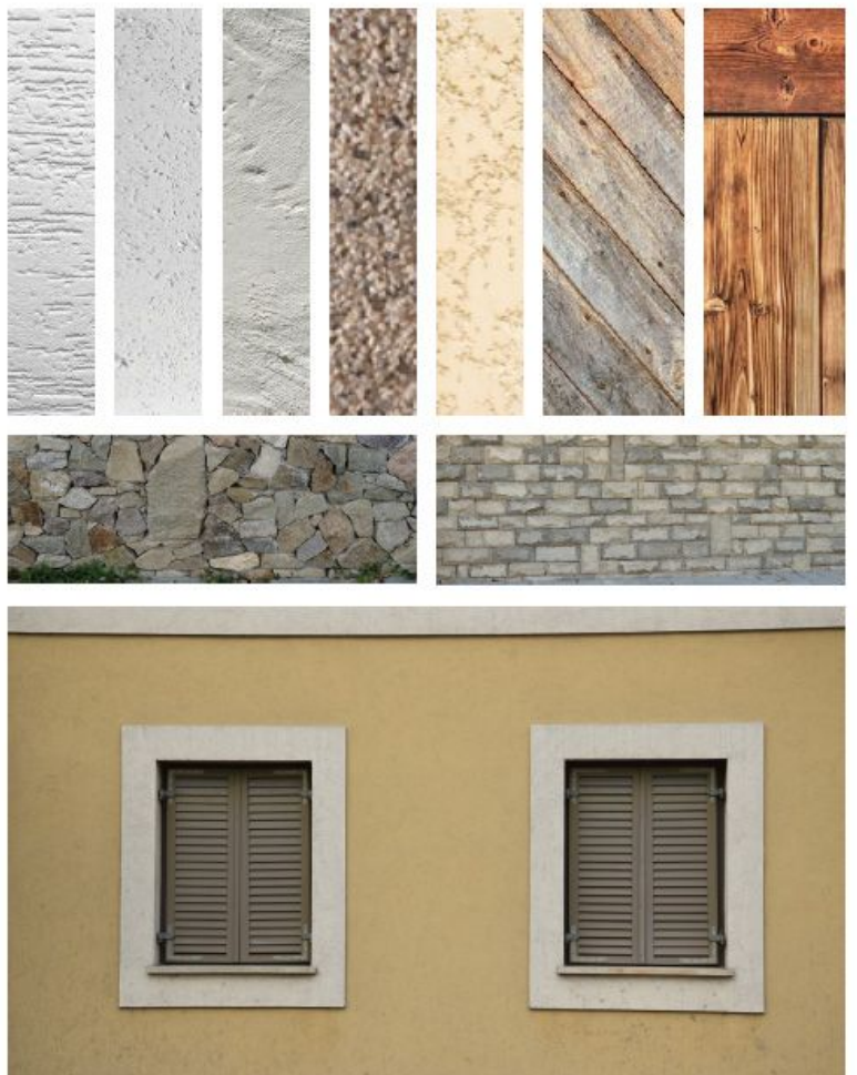
1. ábra 45. oldal

A homlokzati hőszigetelés esetén általános tudnivaló, hogy 10 cm-es vastagságig a közterületi telekhatáron álló épülethomlokzat esetén is lehet alkalmazni. A színek alkalmazásának tekintetében különbséget kell tenni a hagyományos településközpont és a kertvárosias beépítésű terület között. Az előbbi esetében több kötöttség van. Jellemzően természetes anyagokat és világos színárnyalatokat kell használni. A településre jellemző az ablakok körüli vakolatkeretek alkalmazása, mely akkor tud karakteres lenni, ha színezése eltér az alapfelülettől. A TAK-ban ajánlott homlokzati anyagok színek a következők: