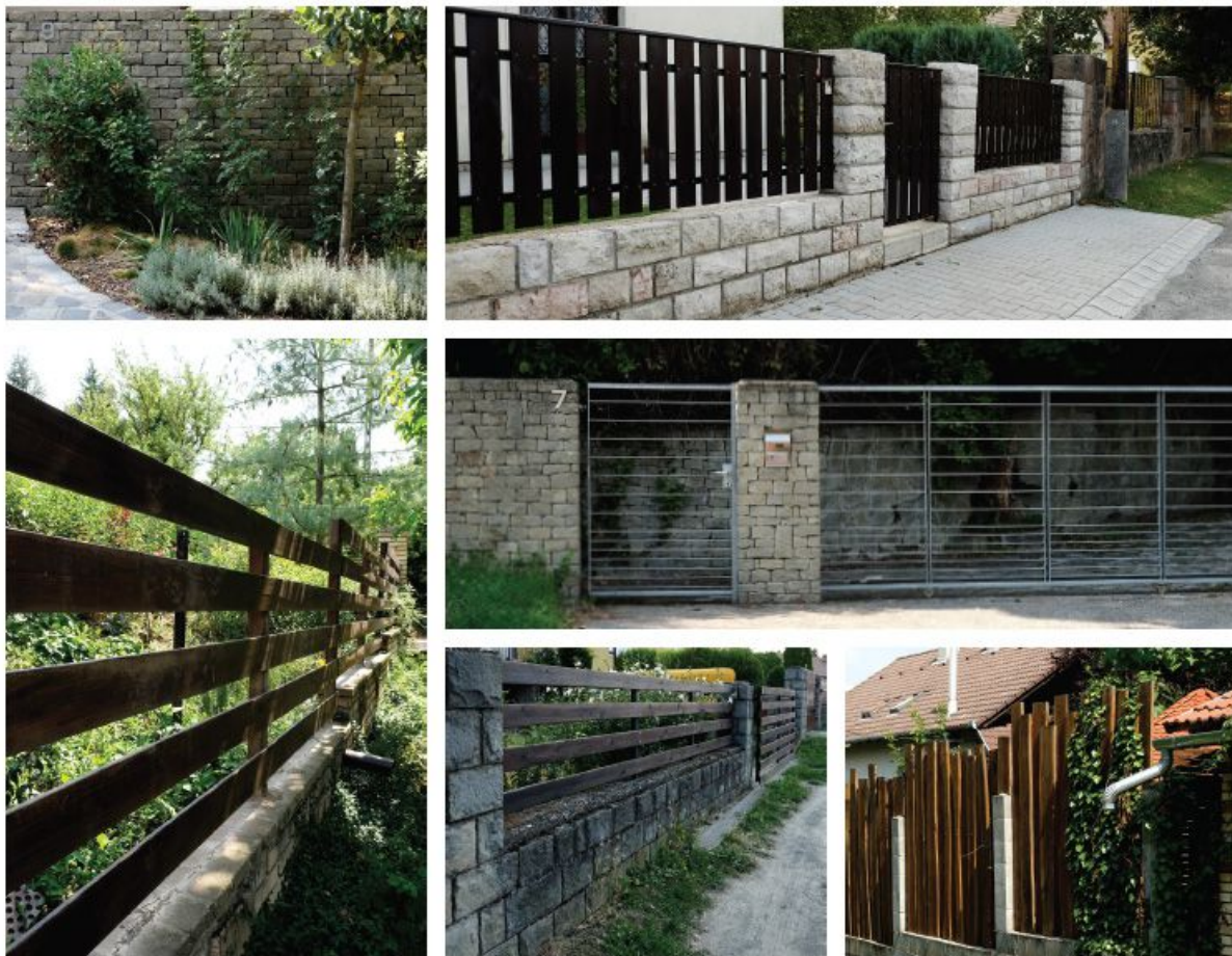
5. ábra 53. oldal

Utólagos tetőtér beépítés esetén minden esetben felmerül az igény tetőablak beépítésére. A hagyományos településközpontban általános szabály, hogy ilyen esetben tetősík ablakot kell alkalmazni. Tetőfelépítmény csak különösen indokolt esetben alkalmazható, melynek pontos kialakítását főépítész konzultáción lehet egyeztetni. A tetősík ablakok utcára néző tetőfelületen nem lehetnek. Hagyományos épület utólagos tetőtér beépítésénél az ormfalon új ablaknyílást nem lehet nyitni.