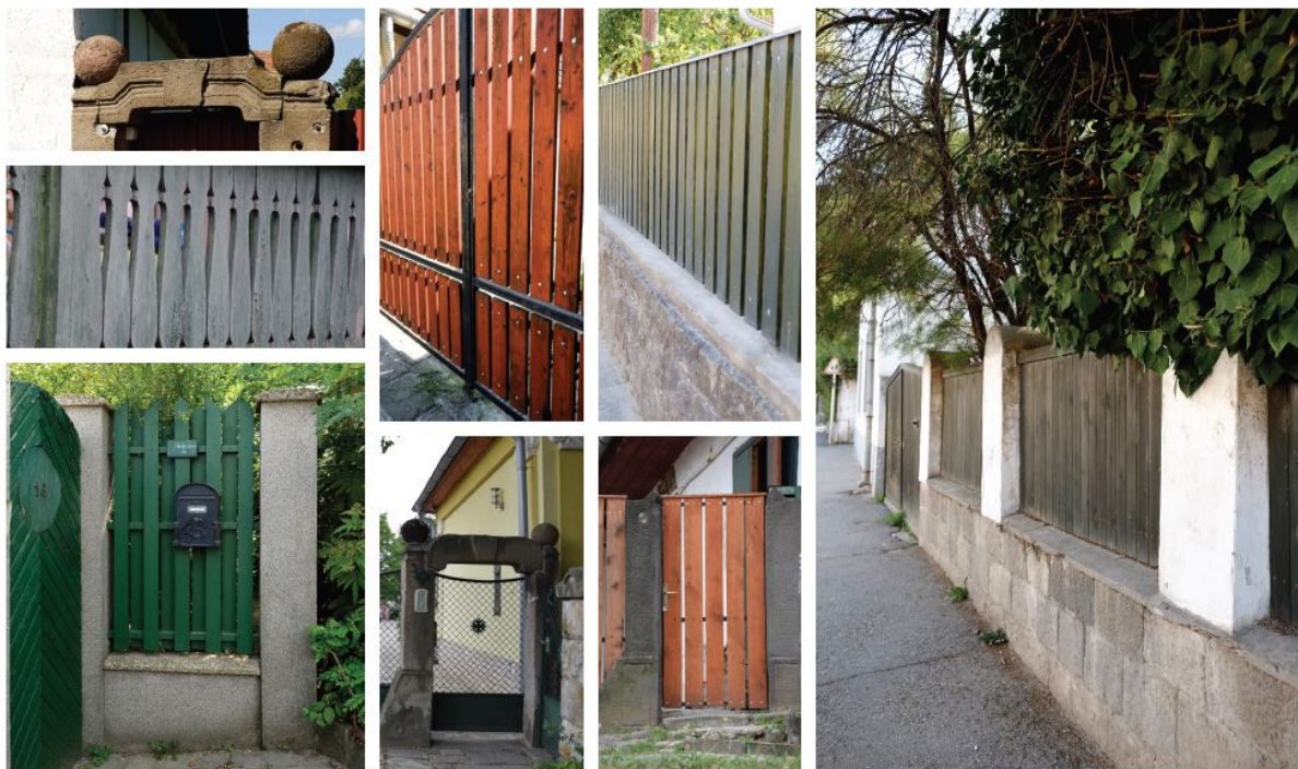
4. ábra 42. oldal

A kertvárosias övezetben is a hagyományos kerítés kialakítás a kedvezőbb megoldás, de itt a meglévő vagy tervezett ház arculatához illeszkedő modernebb megjelenés is elfogadható. Minden esetben törekedjünk az egyszerűsége és a praktikumra. A színválasztásnál a kő esetében adott a szín. A vakolt felület vagy szürke, szürkésbarna, esetleg törtfehér legyen, vagy pedig a ház általános vagy lábazati vakolat színével legyen azonos. A fa lécek festésénél a zöld és a barna szín árnyalatait lehet alkalmazni.