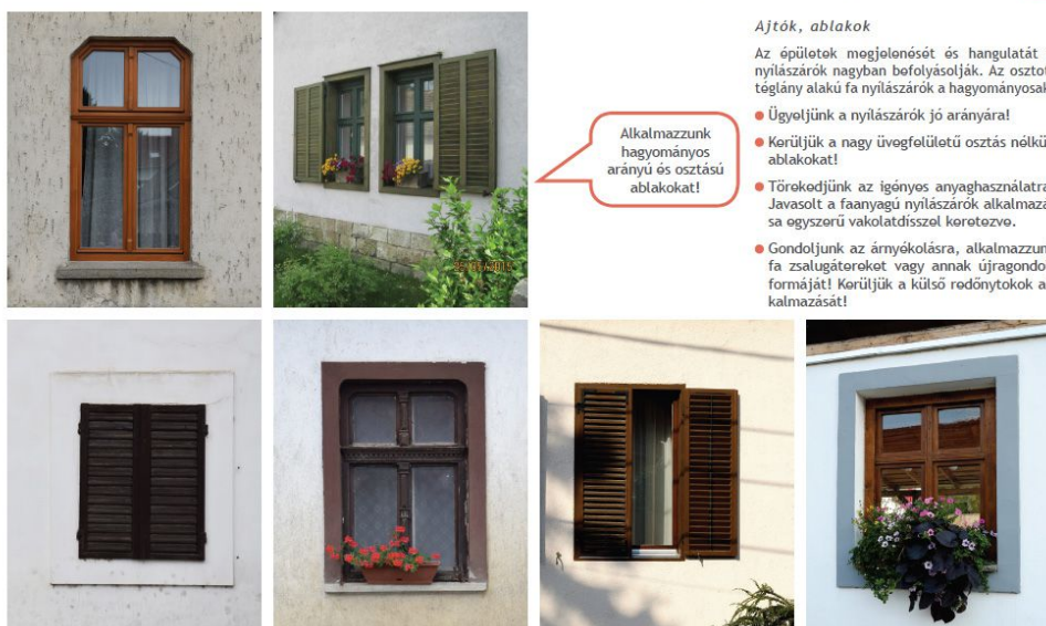
3. ábra 43. oldal

A nyílászáró cserék esetében szintén fontos különbség van a két eltérő karakterű terület között. A TAK szerint a hagyományos településközpont esetében csak fa szerkezetű, vagy fa mintázatú ablakok használhatóak. Ettől csak abban az esetben lehet eltérni, hogy ha új ablaknyílás készül, és azt célszerűen az egységes homlokzati megjelenés miatt a meglévő ablakokkal azonos módon alakítják ki.